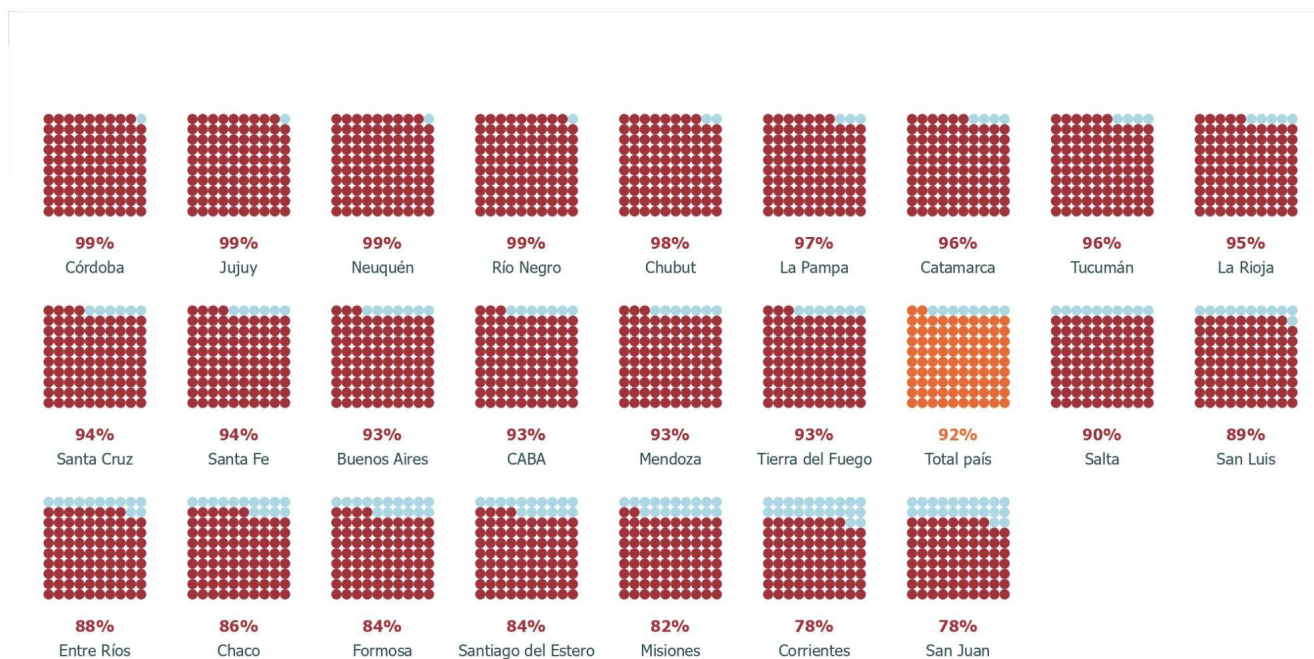
Gráfico 2. Porcentaje de estudiantes que inició 1er grado en 2016 en edad teórica y llegó al 6to grado en edad teórica por provincia.